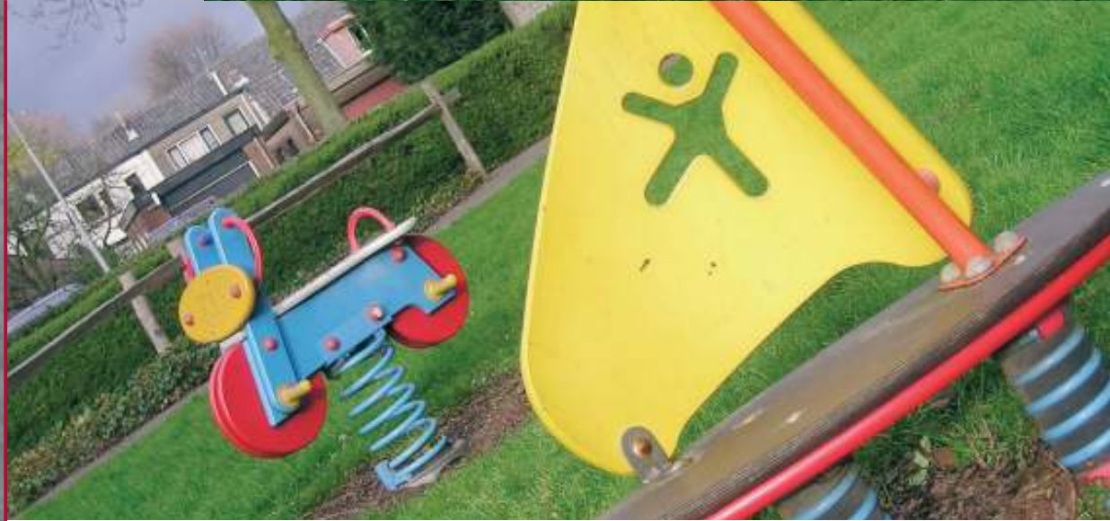
Jong in de Hertogenwijk: van wipkip tot graffiti