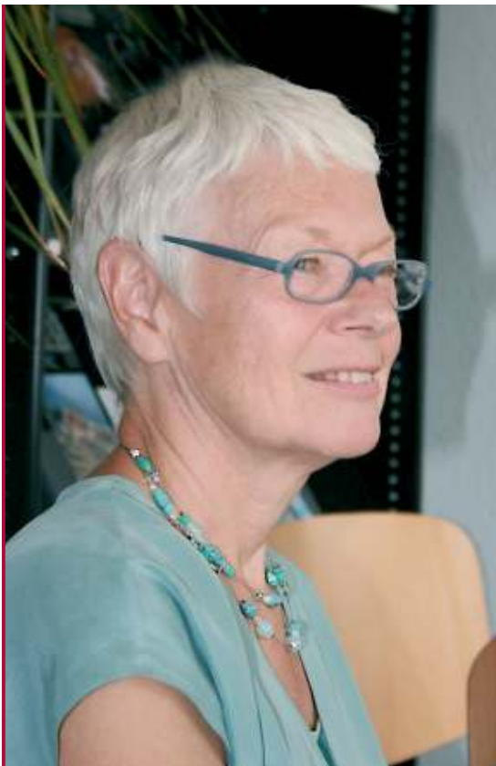
TOOS GROEN STICHTING HERTOGENWIJK