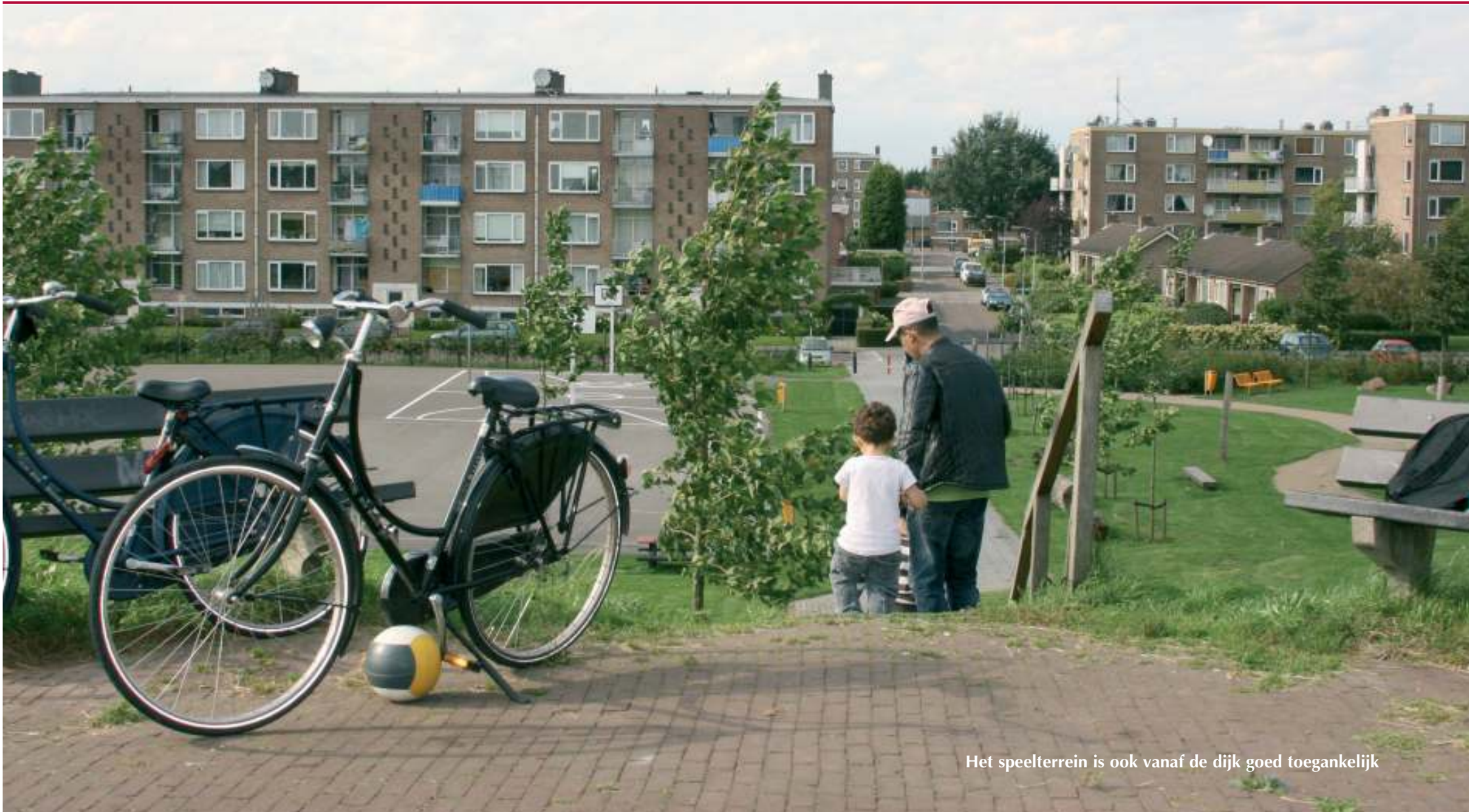
Het speelterrein is ook vanaf de dijk goed toegankelijk

een afgesloten voordeur en wie ergens wil zijn, moet eerst bellen. Nog wensen? „Gezondheid is het belangrijkste”, zegt hij zonder aarzelen.