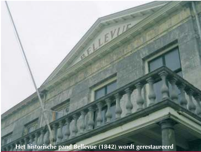
Het historische pand Bellevue (1842) wordt gerestaureerd