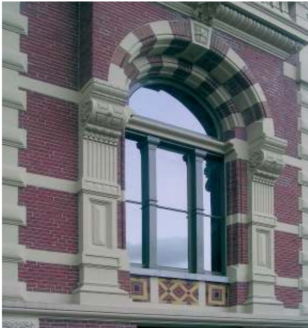
Het monumentale gerechtsgebouw