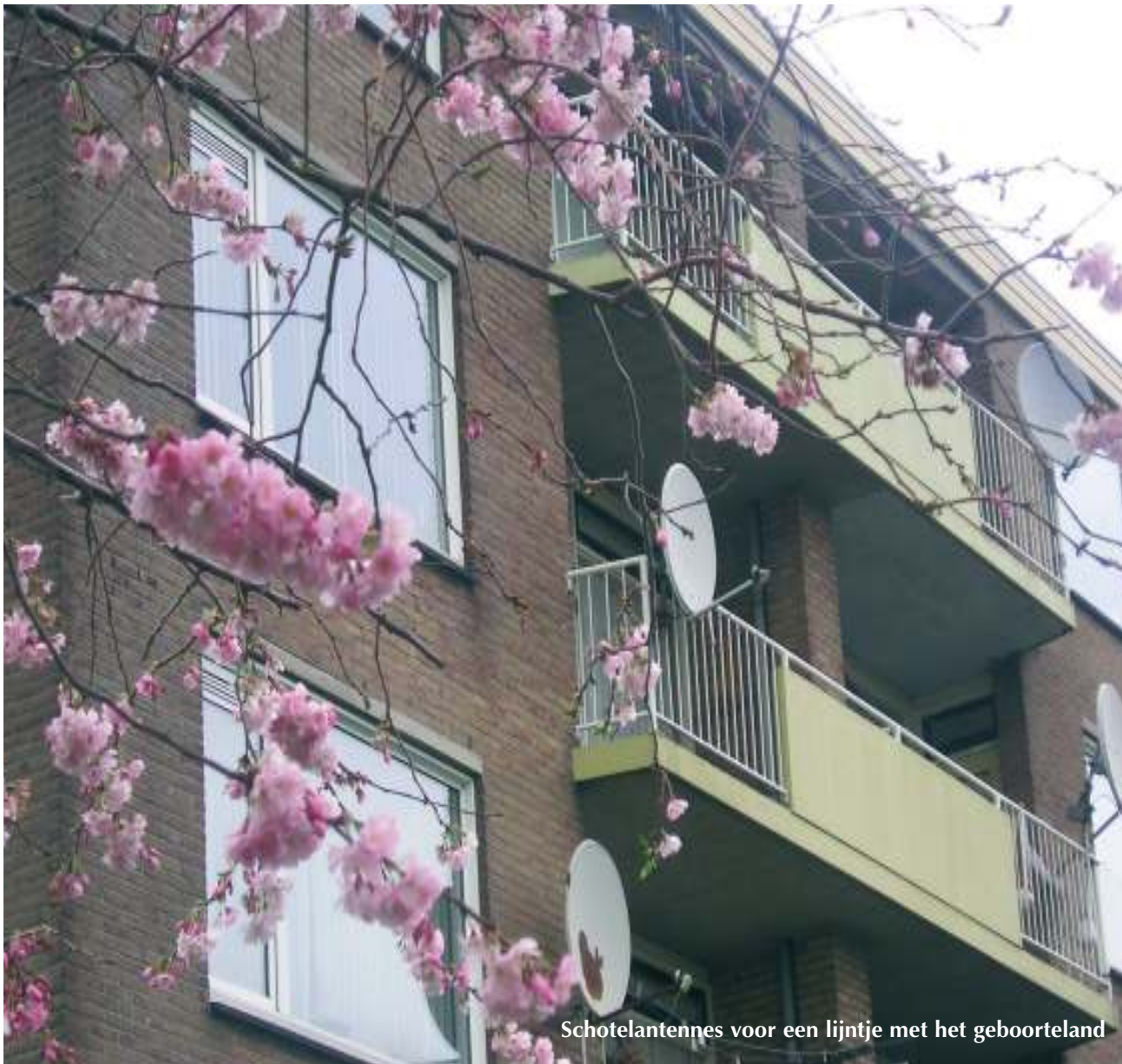
Schotelantennes voor een lijntje met het geboorteland

TEKST: CISCA VAN DE RIET