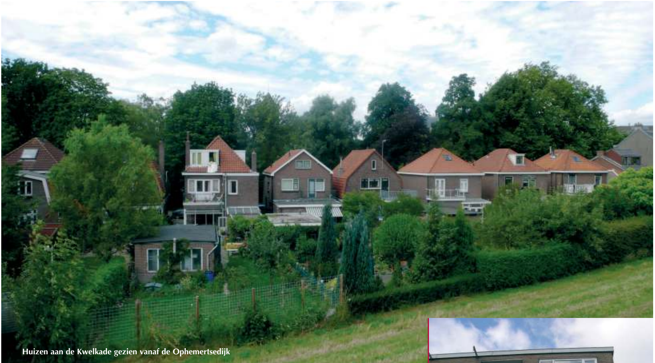
Huizen aan de Kwelkade gezien vanaf de Ophemertsedijk