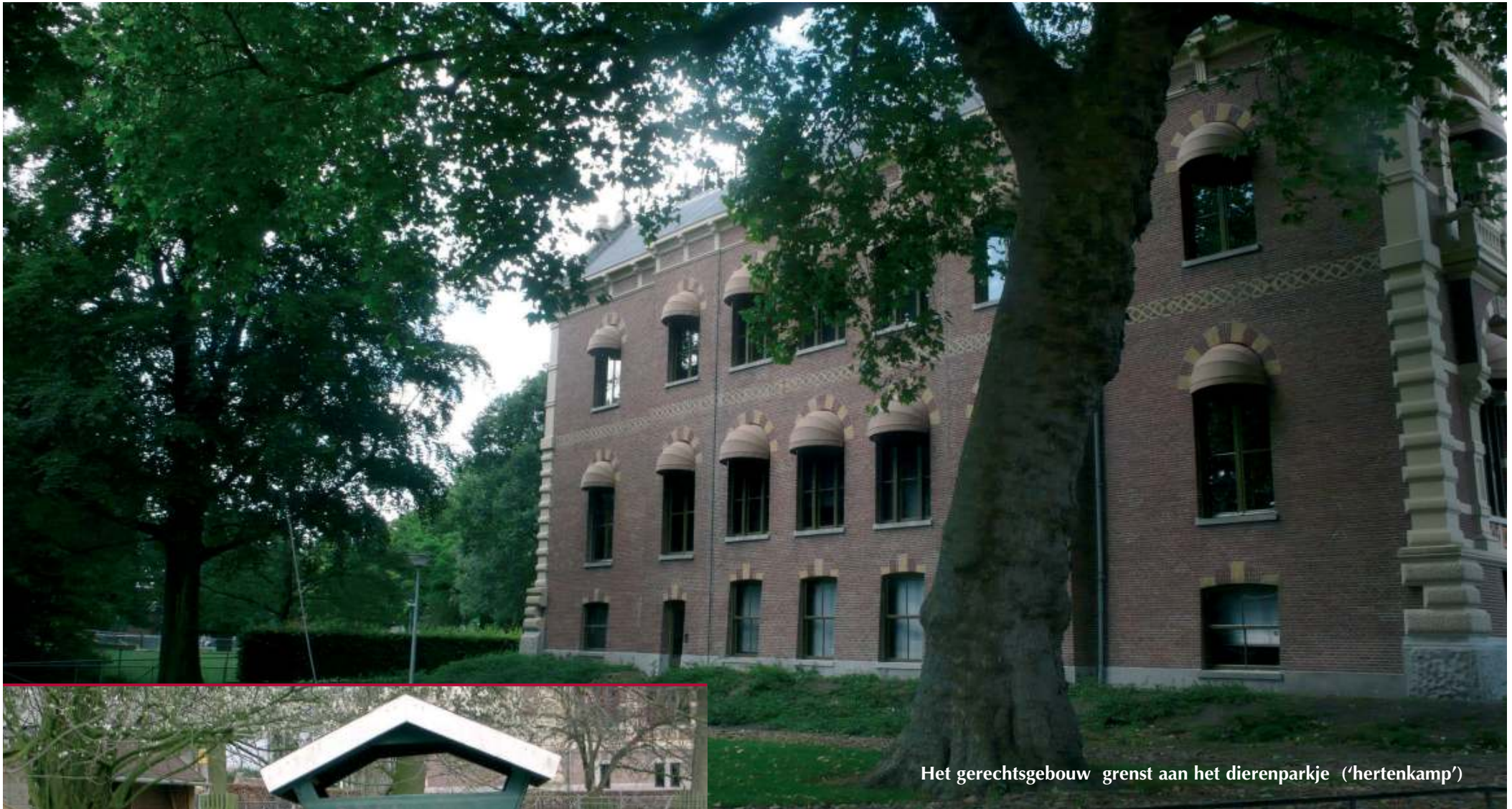
Het gerechtsgebouw grenst aan het dierenparkje ('hertenkamp')