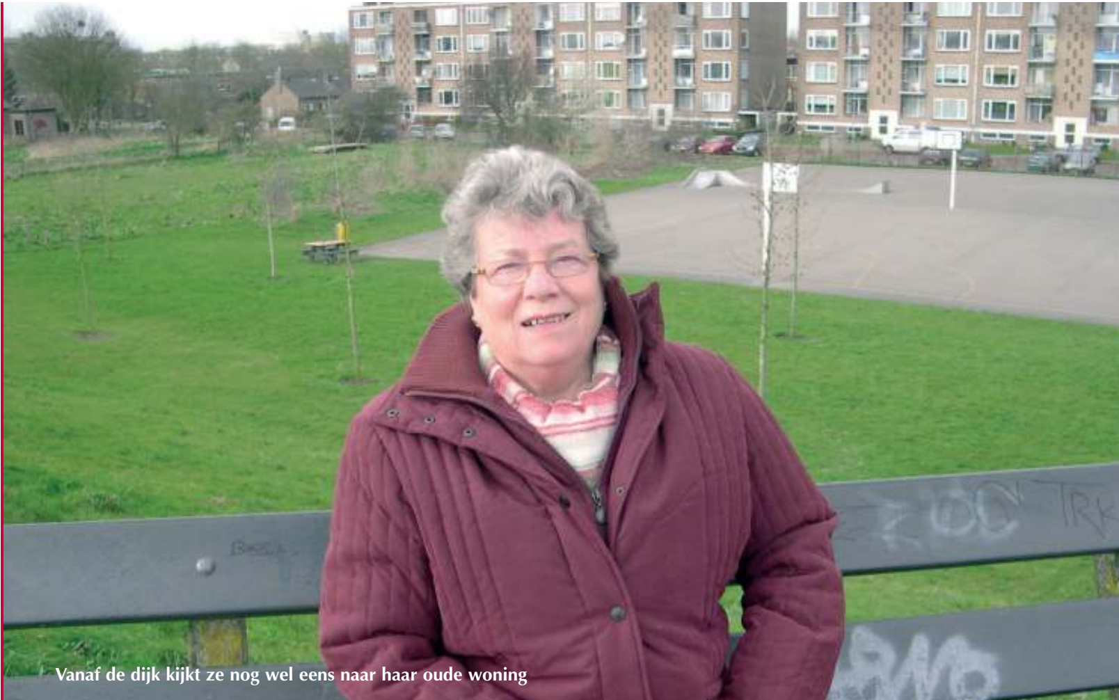
Vanaf de dijk kijkt ze nog wel eens naar haar oude woning