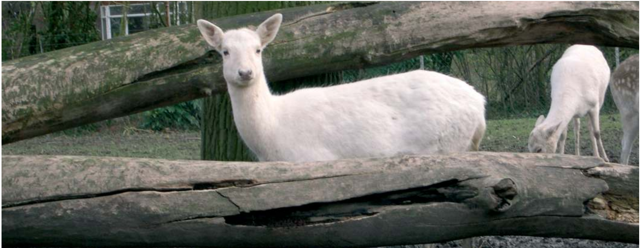
Een deel van de levende have in het dierenparkje